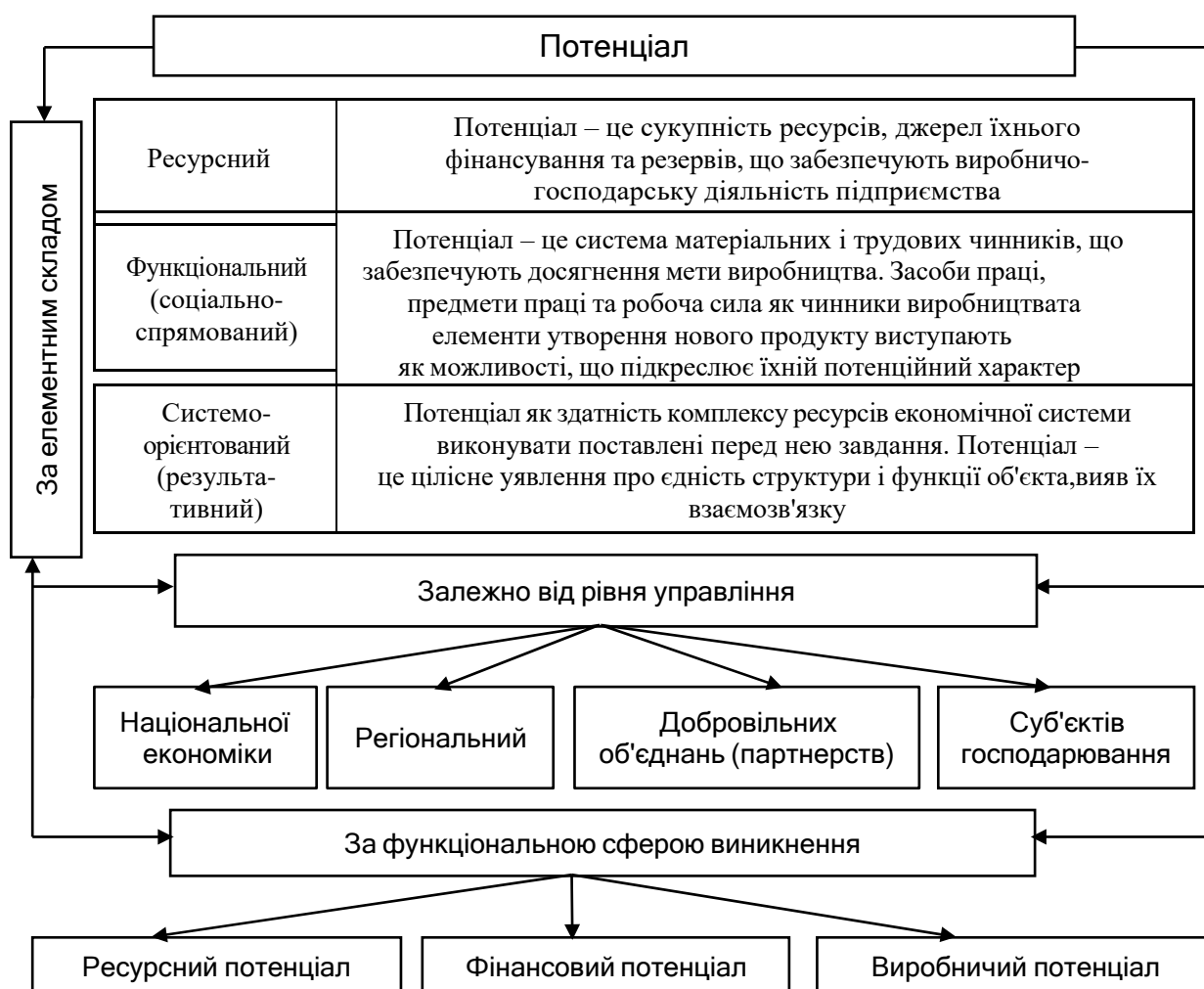
Рис. 2.1. Підходи до поняття "потенціал"

Приклад оформлення рисунка та посилання на нього наведено далі. Далі необхідно проаналізувати підходи до поняття "потенціал", наведені на рис. 2.1.