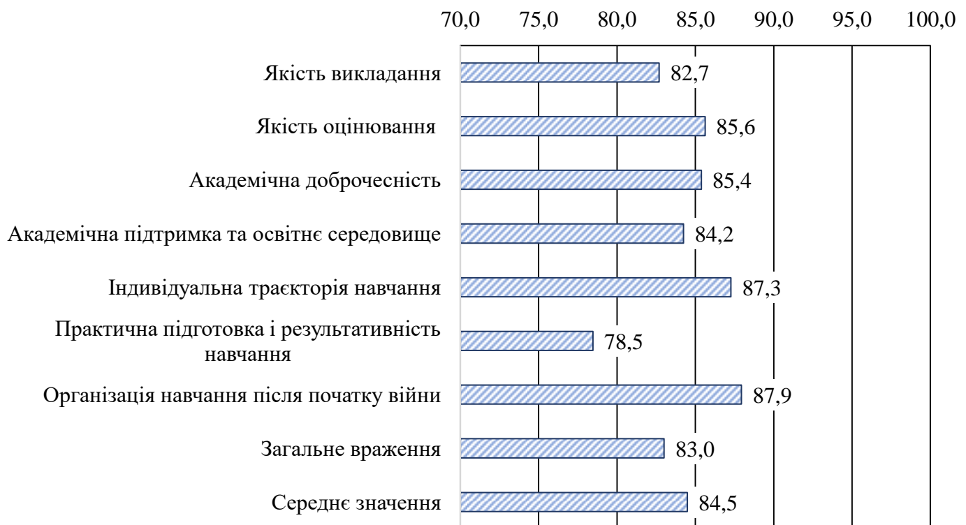
Рис. 1. Рівень задоволеності якістю ОП здобувачів вищої освіти бакалаврату за блоками питань (у % від кількості респондентів)

Анкета містить 40 запитань, 8 блоків питань У блоках питань «Навчання після початку війни» та «Індивідуальна траєкторія навчання» оцінки задоволеності виявилися вищими, ніж у інших блоках; у блоці «Практична підготовка і результативність» навчання оцінка нижче за інші блоки (рис.1).