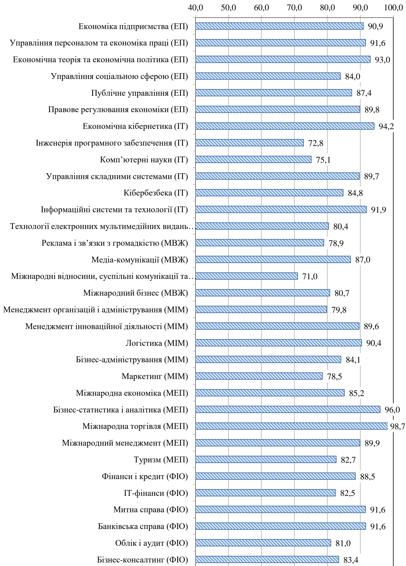
Рис. 2. Оцінки задоволеності якістю освітніх програм бакалаврату, (у % від кількості респондентів)