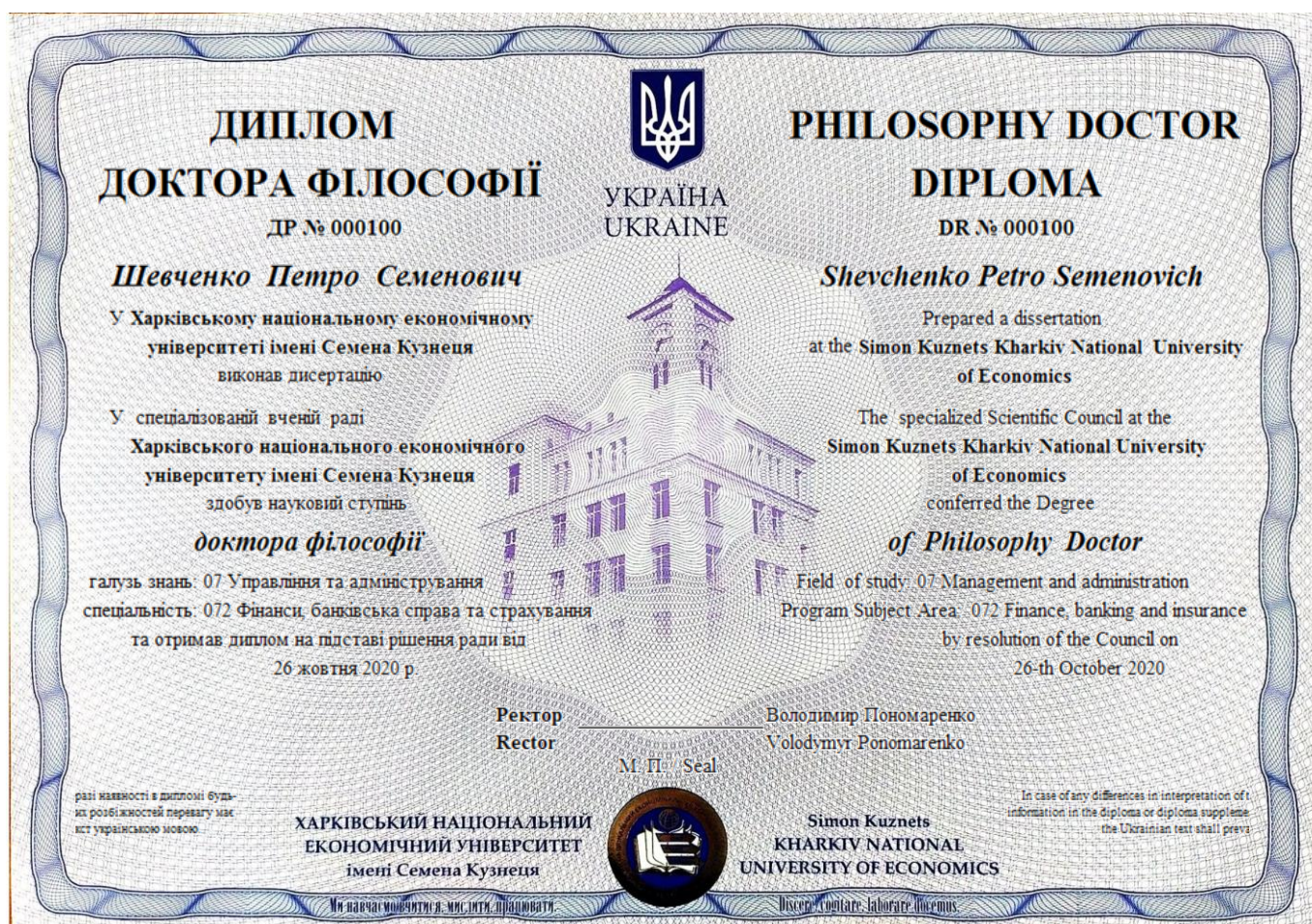
Рис. 2. Зразок диплома доктора філософії

3.11. Зовнішній розворот бланка диплома доктора філософії призначений для проставлення штампів консульської легалізації та апостилю і не містить жодних написів.