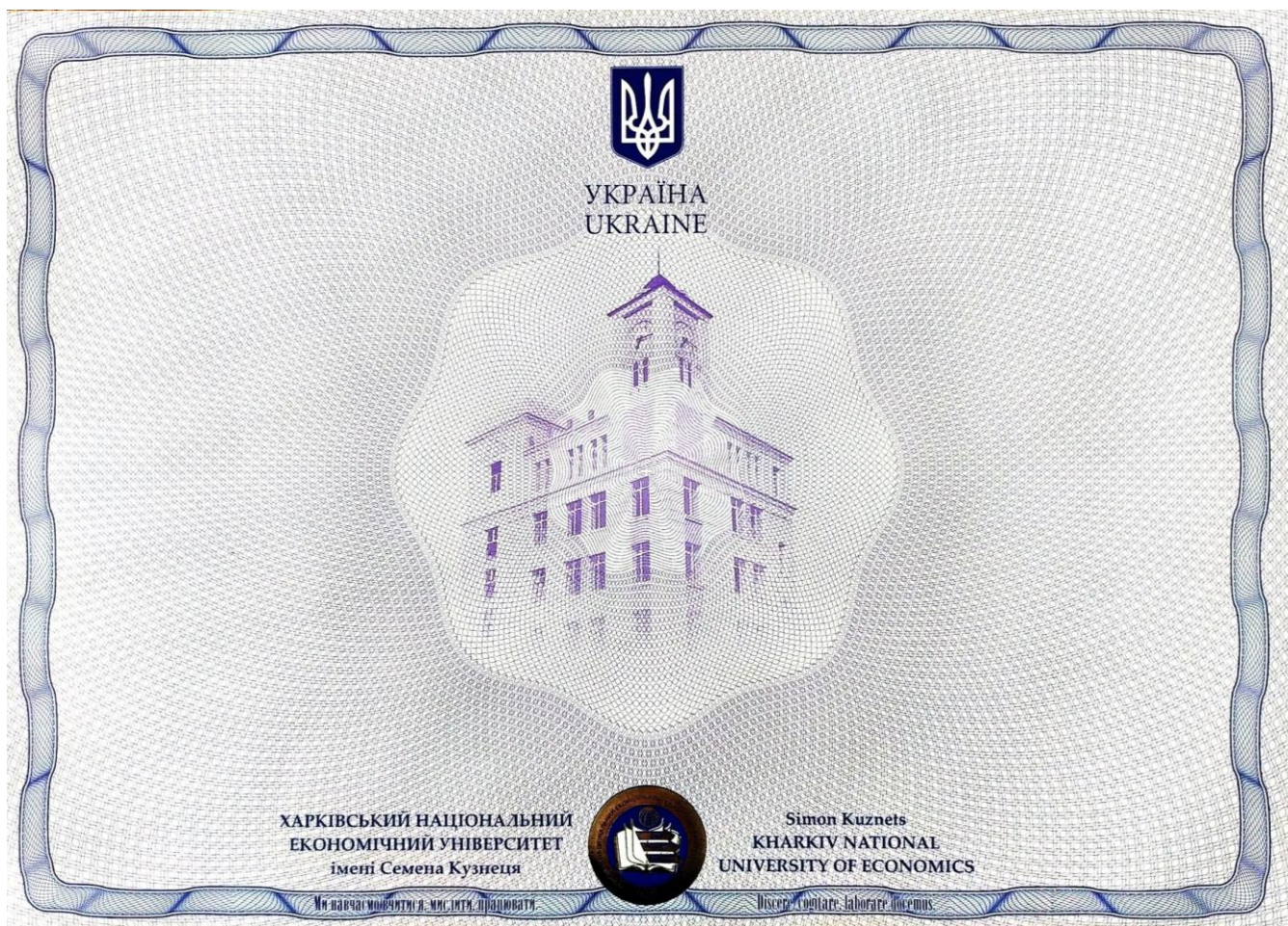
Рис. 1. Дизайн бланку диплому доктора філософії

3.7. Дизайн (незаповненого) бланку диплому доктора філософії зображено на рис. 1.