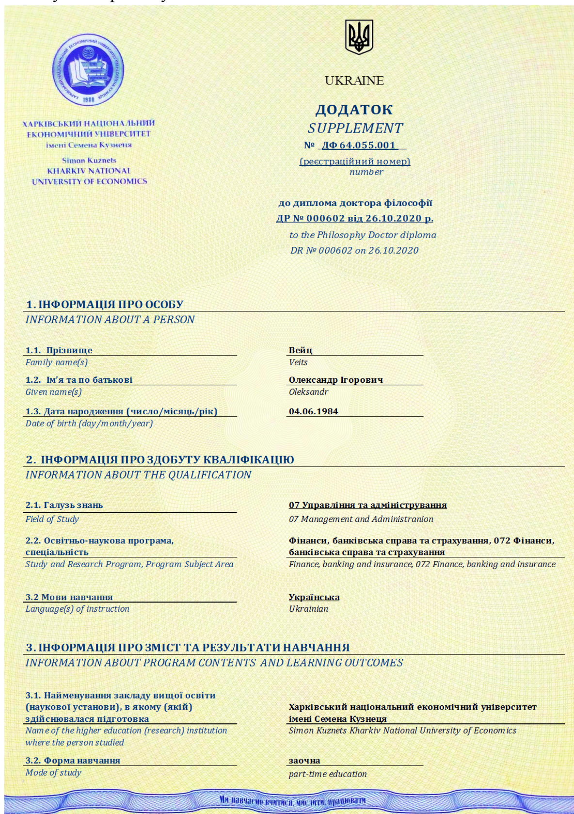
Рис. 4. Зразок 1-го аркуша додатку до диплома доктора філософії європейського зразка: 1-ша сторінка (титул)

пронумерованих аркушів, проставлено підпис відповідальної особи за замовлення, заповнення, видачу та облік дипломів доктора філософії посадової та печатку Університету.