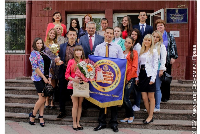
ХНЕУ - Факультет Економіки і Права

техніко-економічні розрахунки потреби в ресурсах, рівня їх використання та результатів; роботу у глобальному контексті, включаючи здібності до роботи в мультикультурних командах; старанно підтримувати високі етичні стандарти поведінки особисті і у команді;