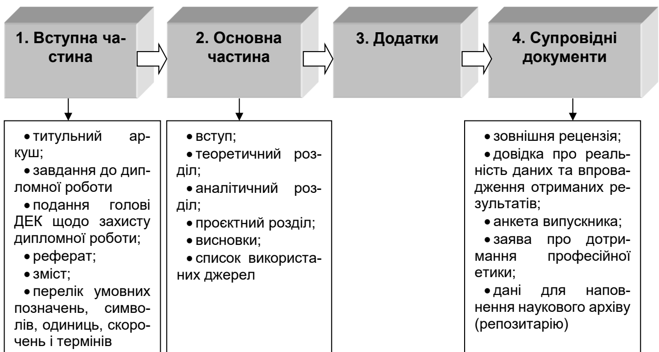
Рис. 2.1. Загальна структура магістерської дипломної роботи

Загальну структуру магістерської дипломної роботи наведено на рис. 2.1.