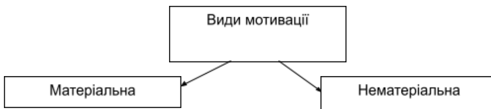
Рис. 1.1. Види мотивації

Ілюстрація позначається словом "Рис. __", яке разом з назвою ілюстрації розміщують після пояснювальних даних. Ілюстрації слід нумерувати арабськими цифрами порядковою нумерацією в межах розділу, за винятком ілюстрацій, наведених в додатках. Номер ілюстрації складається з номера розділу і порядкового номера ілюстрації, між якими ставиться крапка, наприклад рис. 1.1. – перший рисунок першого розділу. Приклад ілюстрацій наведено далі (рис. 1.1).