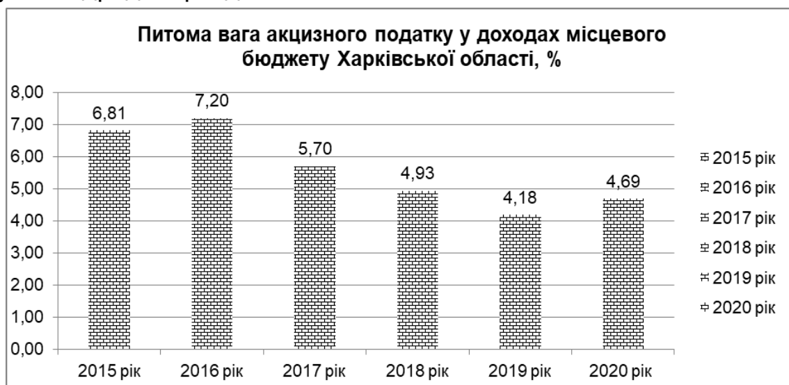
Рис. 2.3. Питома вага акцизного податку у податкових надходженнях

Далі необхідно зробити висновки щодо динаміки показників, наведених на рис. 2.3. Не можна закінчувати розділ або підрозділ рисунком без тексту на сторінці. Не бажано розташовувати декілька рисунків підряд не розділяючи їх текстом із поясненнями.